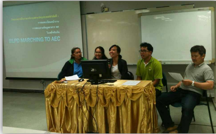
ภาพที่ 6 : ผู้รับผิดชอบนำเสนอข้อมูลที่จัดทำ