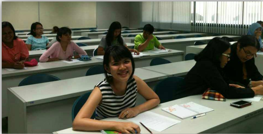
ภาพที่ 7: ฝึกสนทนาและตรวจสอบความถูกต้องของโครงสร้างประโยคภาษาอังกฤษ