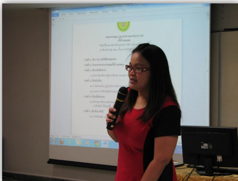
ภาพที่ 1: การแสดงความคิดเห็นในการหารือการจัดทำแผน