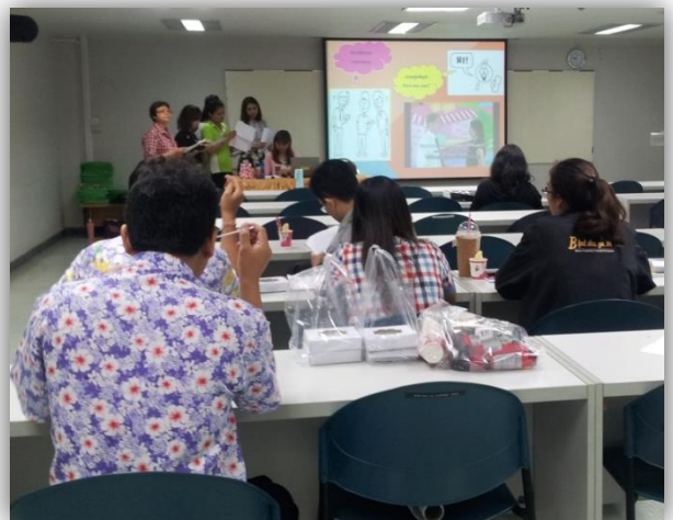
ภาพที่ 10: ผู้รับผิดชอบจัดเตรียมเนื้อหาและนำเสนอข้อมูล