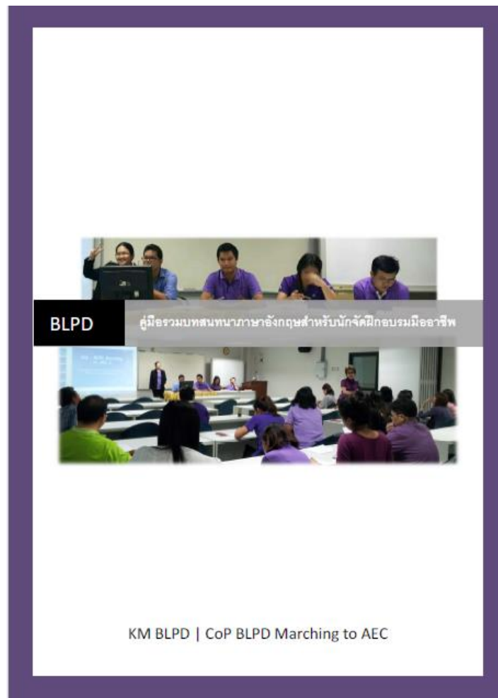
ภาพที่ 1 : หน้าปกเล่มคู่มือรวบรวมบทสนทนาภาษาอังกฤษสำหรับนักจัดฝึกอบรมมืออาชีพ

นอกจากนี้ยังเข้าร่วมประกวดนำเสนอผลงาน CoPs ใน Forum CoPs ของ วศ. ร่วมกับ CoP Smart Trainer ของ พศ. อีก 1 ทีม ซึ่งนำเสนอผลงานโดย ดร.ปวีณา เกร็อนิล การประกวดมี 2 รอบ รอบคัดเลือก รอบที่ 1 เมื่อวันที่ 5 มิถุนายน 2558 ณ ห้องโถง อาคารหอสมุด ดร. ตั้ว ลพานุกรม สามารถผ่านเข้ารอบ 6 CoPs สุดท้ายจาก 21 CoPs ที่เข้าประกวด และได้รางวัลชนะเลิศในการแข่งขันรอบที่ 2 ในกิจกรรมวันแห่งการจัดการความรู้ วศ. ประจำปี 2558 เมื่อวันที่ 10-11 กรกฎาคม 2558 ณ กรีนเนอร์รี่ รีสอร์ท ปากช่อง จ.นครราชสีมา