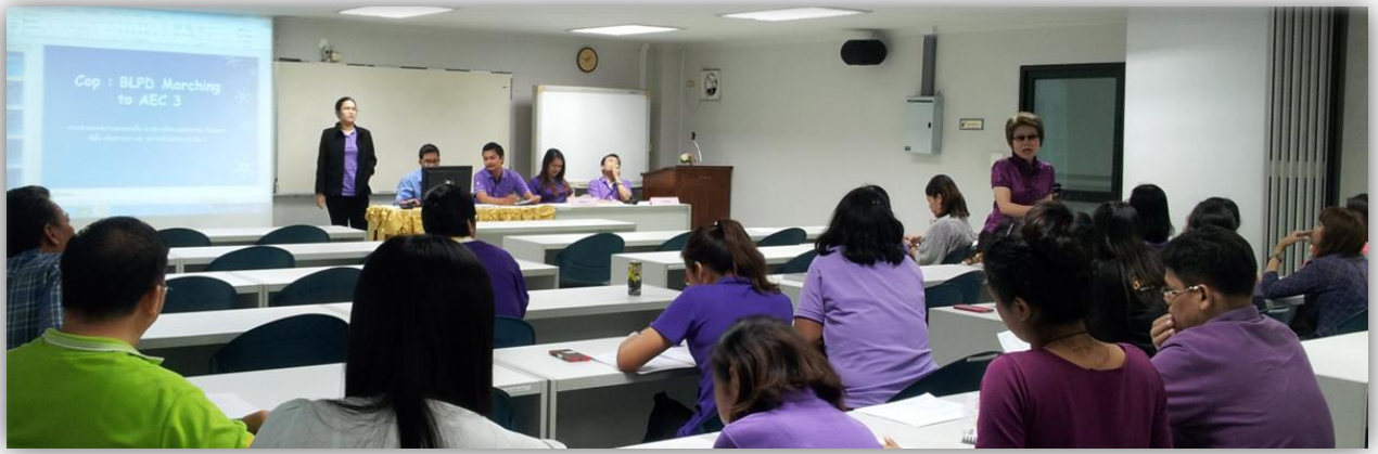
ภาพที่ 8: ผพศ ให้คำแนะนำและร่วมแลกเปลี่ยนเรียนรู้