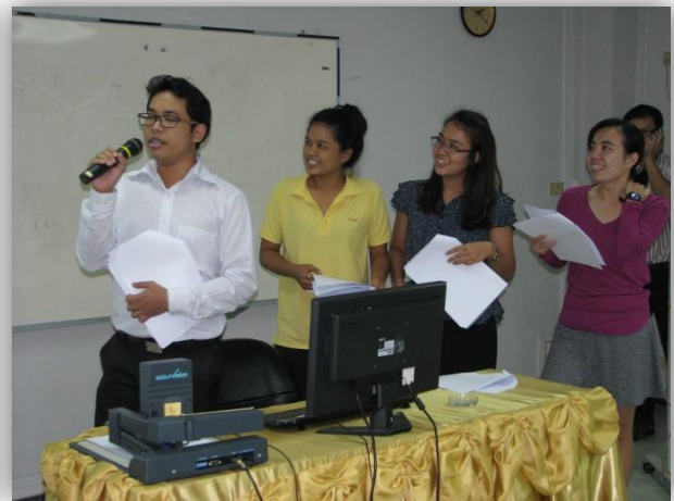
ภาพที่ 4-5: ฝึกสนทนาภาษาอังกฤษ