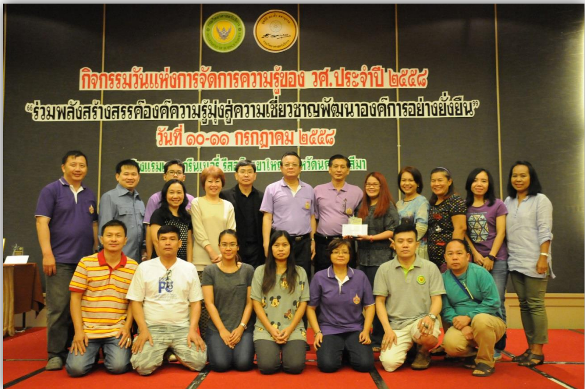
ภาพที่ 5 : CoP BLPD Marching to AEC ได้รับรางวัลชนะเลิศ