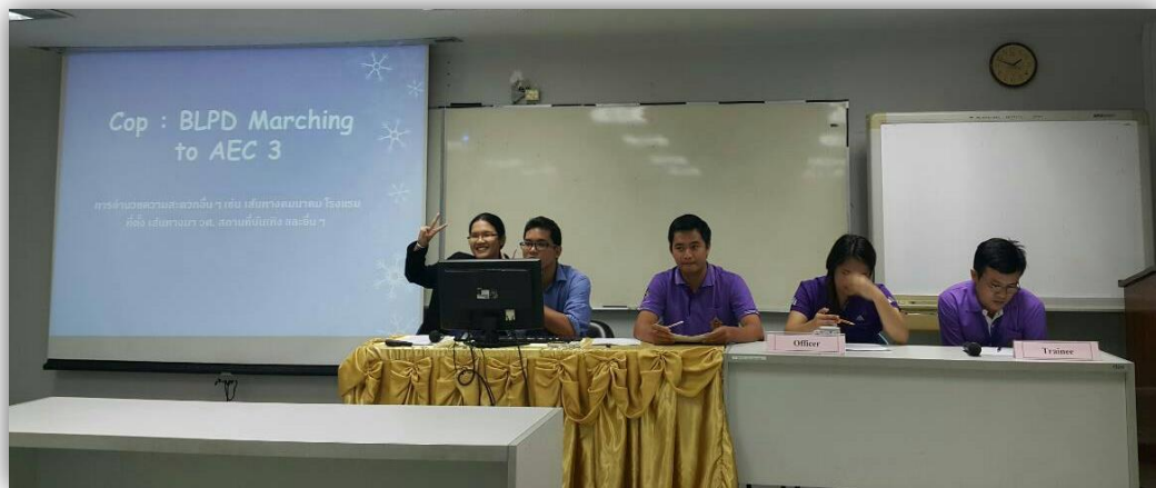
ภาพที่ 9: ผู้รับผิดชอบเตรียมนำเสนอข้อมูล