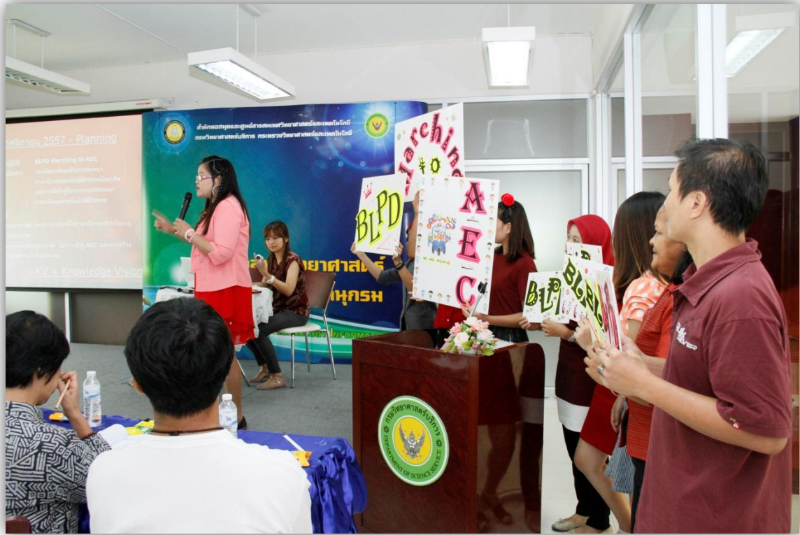
ภาพที่ 2 : การประกวด CoPs ของ วศ. รอบที่ 1