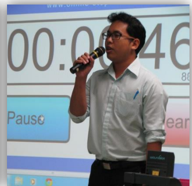
ภาพที่ 2: การสอบวัดความรู้ภาษาอังกฤษ (Pre-test)