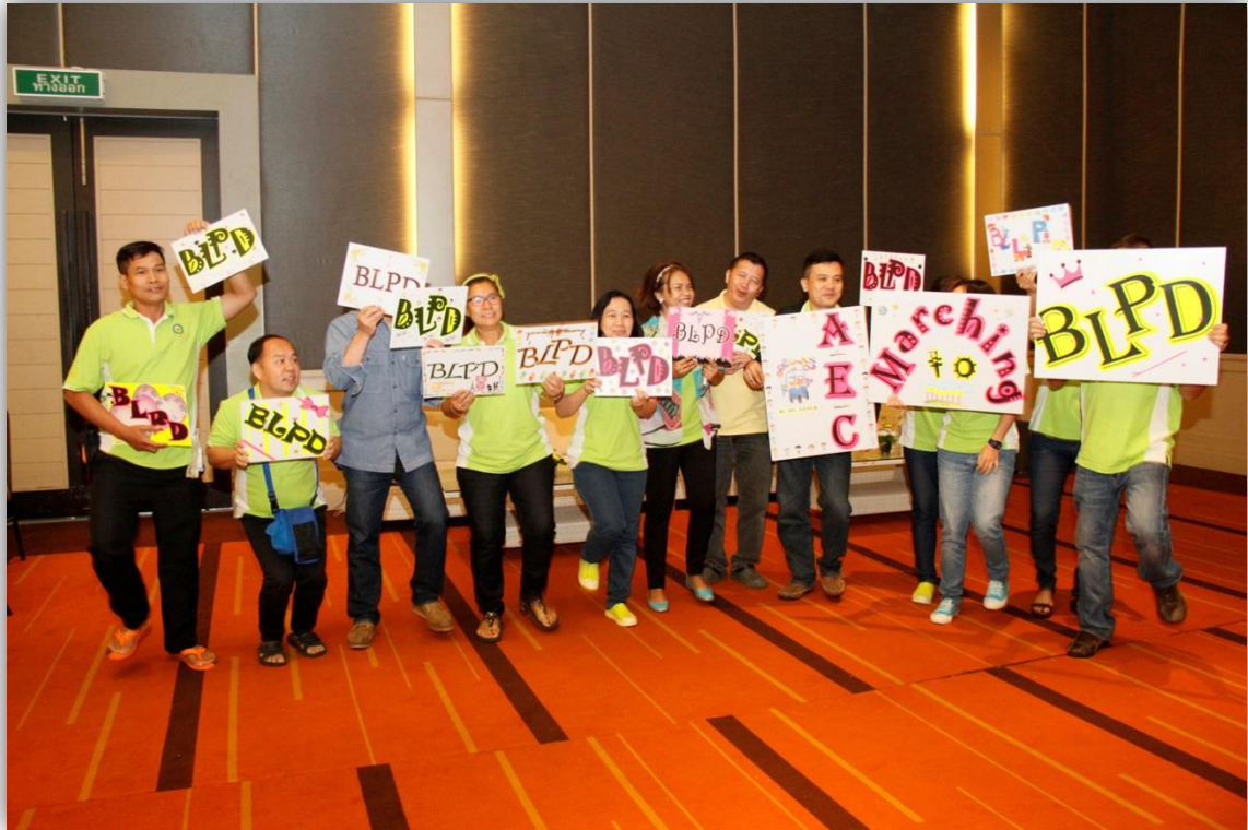
ภาพที่ 4 : สมาชิก CoP ร่วมให้เชียร์ในการแข่งขันรอบที่ 2